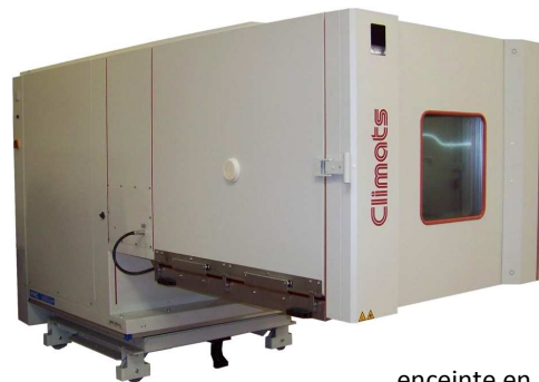
enceinte en position basse

Posée sur 2 rails de 5 m parfaitement alignés, cette enceinte - destinée au secteur de l'électronique - reste mobile sur 2 axes afin de dégager aisément l'espace de travail pour la préparation des tests.